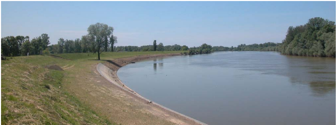
Pogled sa nasipa prema jugu

Rijeka Sava je kao element pejzaža ima i danas veliko značenje za formiranje i oblikovanje Županje, ali nije integralni dio današnjeg tkiva naselja Županja budući da je nasipom visine cca 3 m, odijeljena od same strukture naselja. Najstariji dio Županje, ulice Veliki kraj i Savski kraj, pružaju se okomito na tok rijeke, a samo središte naselja je udaljeno od rijeke. S povišene pozicije, najviše točke nasipa otvaraju se panoramske vizure na grad i širu okolicu. Preko danas neizgrađenog prostora između rijeke Save i naselja, zvanog Šljunčara, pružaju vizure na noviji dio grada u kojemu dominiraju tornjevi – silosi Sladorane.