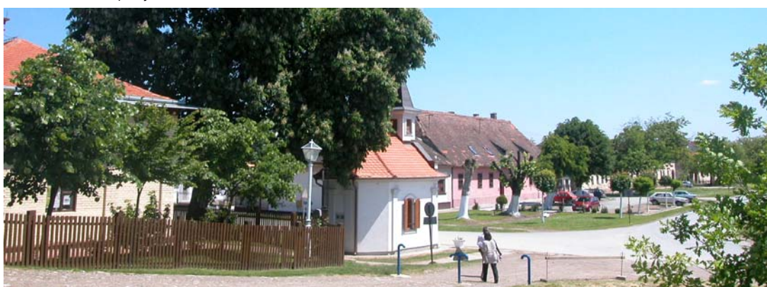
vizura s nasipa rijeke Save na ulicu Veliki kraj