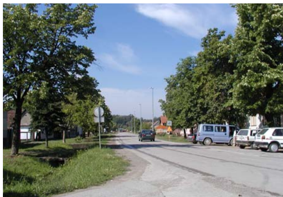
karakteristična "ušorena" ulica sa obostranim drvoredom