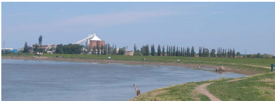
rijeka Sava i vizura na sklop Sladorane