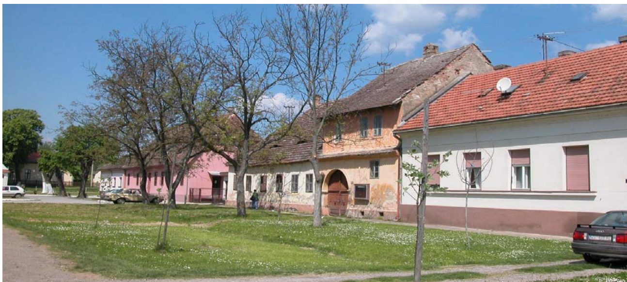
ulica Veliki kraj

Zaštita graditeljske baštine se provodi prema usvojenim načelima integralne zaštite prostora, ali i očuvanjem autentičnosti kroz obnovu izvornih obilježja građevine. Modaliteti zaštite određuju se prema kriteriju zoniranja, (stroga zona zaštite povijesnih struktura i kontaktne zone), te prema propisanim mjerama