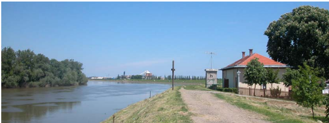
rijeka Sava i zgrada Agencije