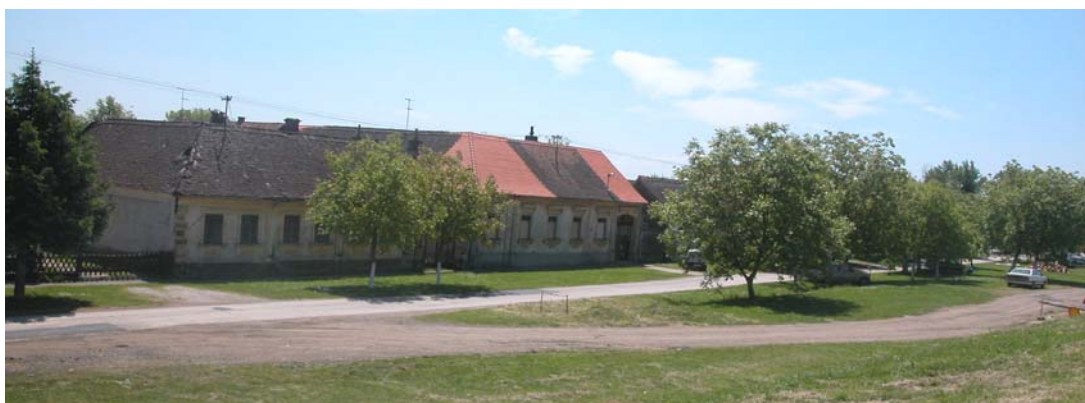
vizura s nasipa rijeke Save na Savsku ulicu